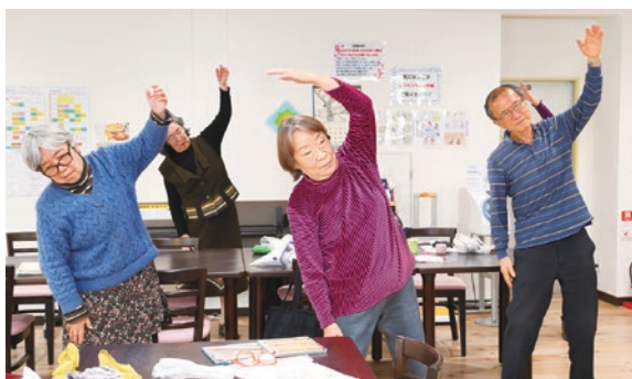
高齢者の健康づくりとフレイル予防を推進します

利用者ごとの趣味や関心に合わせて社会参加先の情報を発信するスマホアプリを導入し、高齢者が元気で過ごせる環境づくりを進めます。初心者を対象としたスマホ教室の実施回数を増やすとともに、習得したい内容を重点的に学ぶ実践的な教室を新たに開催し、高齢者のデジタル格差解消を