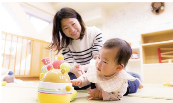
すべての妊婦・子育て家庭に寄り添って支援します

国や都と連携し、昨年4月以降に妊娠・出産した方に、妊娠時6万円、出生時15万円、1歳到達時1万円、合計22万円相当のギフトカード等を支給します。