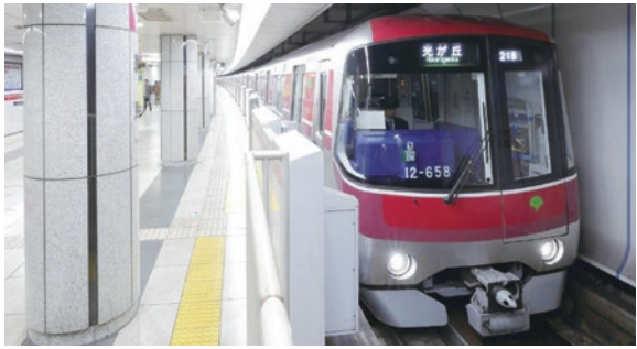
大江戸線延伸の早期事業化を目指し、都と連携して調査・検討を進めています

大江戸線の延伸は、今年度より東京都交通局が、地下鉄12号線の延伸に関する調査と明示した経費を計上し、調査・検討を進めています。来年度区は、都との協議を加速するとともに、早期着手を強く要請します。(仮称)大泉学園町駅予定地周辺では、大泉学園通りの拡幅事業に引き続き取り組むとともに、駅前広場の整備や商業施設等の立地誘導など、新たな拠点づくりを進めます。