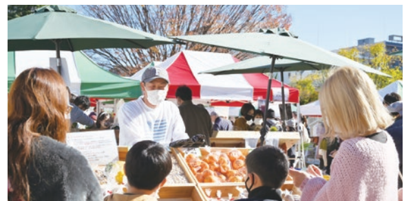
秋の全国都市農業フェスティバルでは、練馬産の採れたて野菜や果物に加えて、全国各地の農産物を販売します

「改革ねりま第Ⅲ章」の実現に向け、引き続き区議会の皆様、区民の皆様と手を携え、練馬区の未来を拓いていく決意です。ご理解、ご協力をよろしくお願いいたします。