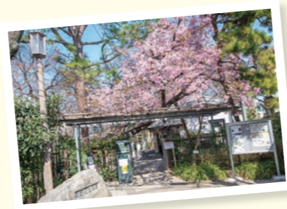
▲春にはオオカンザクラが見頃を迎えます