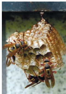
アシナガバチの巣

スズメバチに刺されると危険です。スズメバチの巣ができたときは、相談してください。