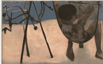
「釣り床」 昭和16年 油彩・キャンバス 東京国立近代美術館蔵