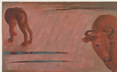
「雨(牛)」 昭和22年 油彩・キャンバス 山口県立美術館蔵