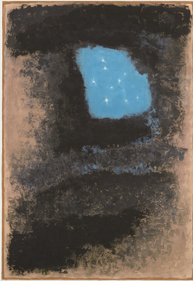
「青の太陽」 昭和44年 油彩・方解末・木炭・キャンバス 山口県立美術館蔵

▶ 観覧料 :一般1,000円、高校・大学生と65～74歳の方800円、中学生以下と75歳以上の方無料 ※一般以外の方は、年齢を確認できるものが必要です。 ※その他割引制度あり。