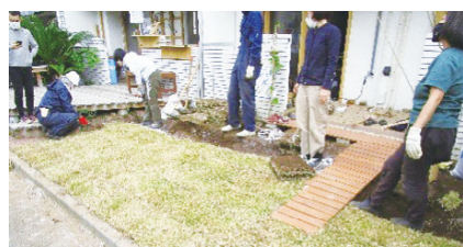
活動拠点の庭を交流スペースとして活用するため、芝生を整備(みどり・はばたき部門)

問合せ みどりのまちづくりセンター(豊玉北5-29-8 練馬センタービル3階) ☎3993-5451(平日午前9時～午後5時) FAX 3993-8070 HP https://nerimachi.jp/