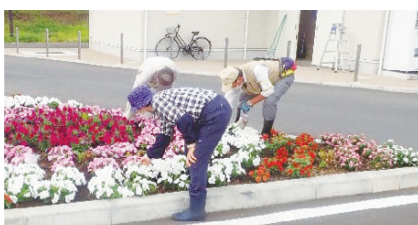
美しい街並みづくりのため、花壇を管理(たまご部門)