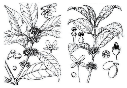
▲左:キンモクセイ、右:ウスギモクセイ。いずれも「牧野日本植物図鑑」(昭和15年)より。

キンモクセイは、中国原産で、挿し木により日本で増やされたというのが通説です。しかし、見た目がほとんど同じで日本に自生する「ウスギモクセイ」の花色の濃いものを選抜して、日本で育成されたという説もあります。身近な植物でありながら、そのルーツははっきりしていません。キンモクセイの香りがしたら、じっくりと観察してみてください。