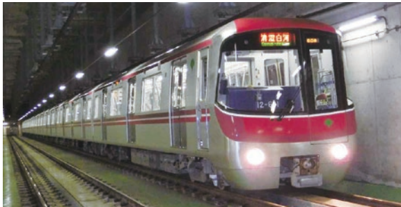
大江戸線延伸の早期事業化を目指し、都との協議を加速します

光が丘駅周辺で更なるバリアフリー化を進めます。駅南側出入口周辺で下りエスカレーター及びスロープの設置工事に着手します。また、練馬光が丘病院の移転に合わせ、駅と病院を結ぶ経路に、視覚障害者誘導用ブロックや案内板を整備します。