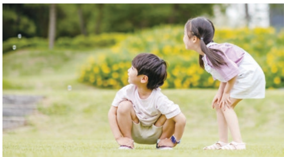
複雑化・深刻化する児童虐待に、都と区が連携して対応します

この度の都の方針により、都区連携による児童相談体制「練馬区モデル」が更に充実し、積極的な位置付けを得て、飛躍的に前進するものと考えています。