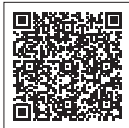
二次元バーコード

人工知能を活用した「相談チャット(チャットボット)」がワクチン接種に関する質問に回答します。