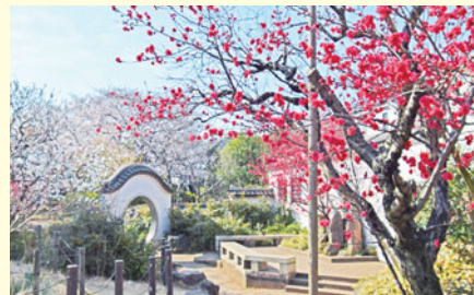
ヘキトウジュ(立野公園)