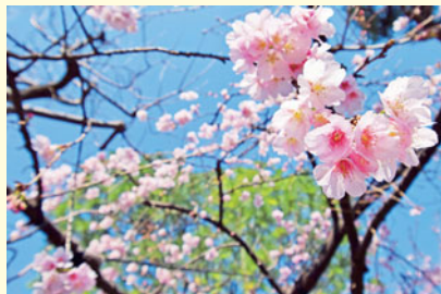
オオカンザクラ(牧野記念庭園)

コロナ禍で、外出を控えている方も多いのではないのでしょうか。今回、ご自宅でも美しい春の風景をお楽しみいただけるよう、区内で撮影した写真を紹介します。▶ 問合せ :広聴広報課庶務係 ☎5984-2694