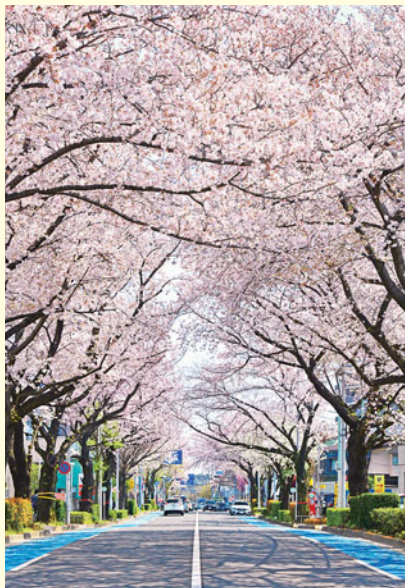
都道443号(練馬春日町方面)