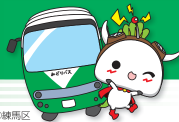
練馬区公式アニメキャラクター「ねり丸」©練馬区