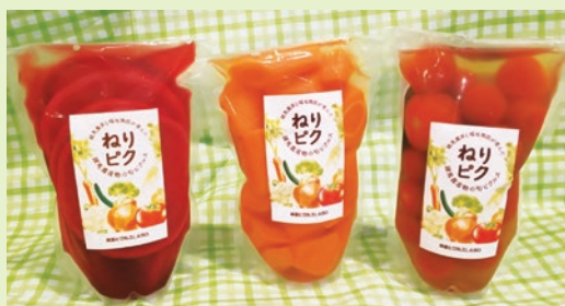
ねりピック(左からむらさき大根、ニンジン、トマト)