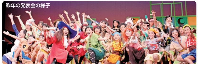
昨年の発表会の様子