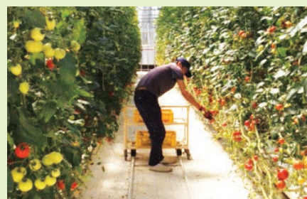
収穫の様子(山口農園)