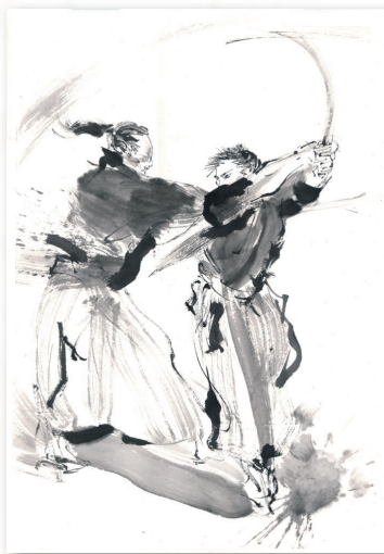
涌井陽一描き下ろし墨絵「孤剣」