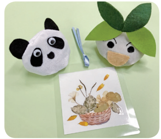
お手玉・押し花のしおり