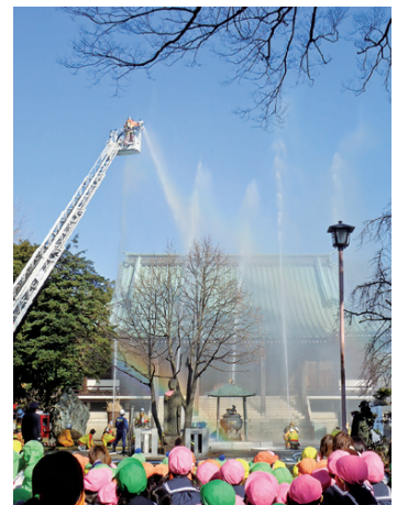
昨年の消防演習の様子

▶日時・場所:①1月24日(水)午前10時から…氷川神社(豊玉南2-15-5)、本覚寺(旭町1-26-5)②1月26日(金)午前10時から…本立寺(関町北4-16-3)、長命寺(高野台3-10-3) ▶問合せ:伝統文化係☎5984-2442