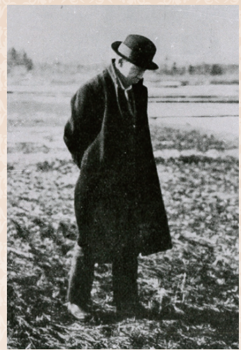
宮沢賢治