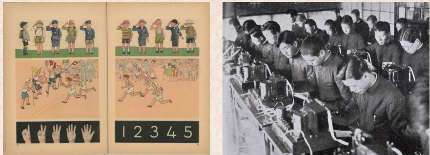
尋常小学算術 第一学年児童用(昭和10年) 東京高等無線電信学校 モールズ印字機による送信術の練習(昭和14年)

明治5年の学制発布により、公立学校による教育が始まりました。大正期以降、練馬の広い土地や豊かな自然を求めて、さまざまな学校が進出しました。本展では、練馬区域に進出した学校の歩みをたどります。 ▶日時:4月21日(土)~6月10日(日)午前9時~午後6時 ※月曜休館(ただし、祝休日の場合は翌平日休館)。