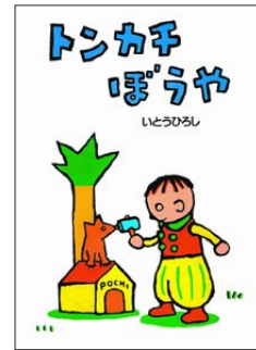
「トンカチぼうや」 クレヨンハウス

サインを希望する方は、いとうさんの著作をお持ちください(色紙などは不可。1人1冊)。整理券を午後1時40分から先着50名に配布します。