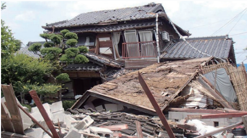
熊本地震による被害の様子

平成28年4月に発生した熊本地震では、倒壊した建物に昭和56年5月以前の古い耐震基準で建築された住宅が多数ありました。区では、昭和56年5月以前に建築された住宅を対象に、無料の簡易耐震診断を実施し、耐震診断や耐震改修工事などにかかる費用の一部を助成しています。制度の概要など詳しくは、お問い合わせいただくか、区ホームページをご覧ください。