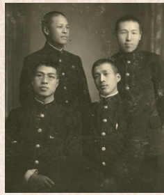
同人誌「アザリア」の仲間たちと

▶日時:4月14日(土)~7月1日(日)午前9時~午後6時 ※月曜休室(ただし、祝休日の場合は翌平日休室)。