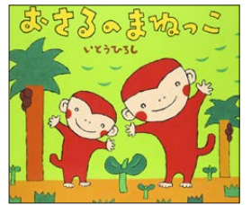
「おさるのえほん」 シリーズ 講談社