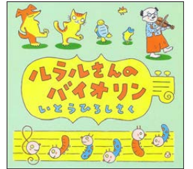
「ルラルさんのえほん」 シリーズ ポプラ社