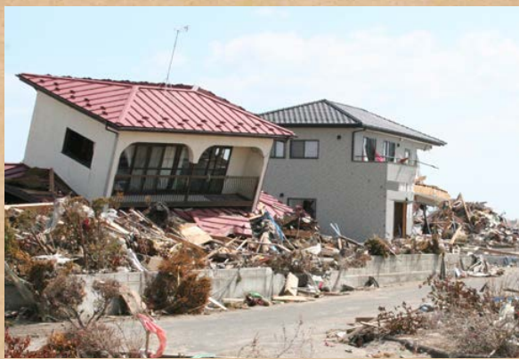
被災後の宮城県仙台市の様子

未曾有の被害をもたらした東日本大震災から7年。 災害は、時と場所を選ばず、突然やってきます。 例えば、仕事や買い物をしている時、 お子さんの留守番中・・・。 家族や大切な人をどうやって守りますか？