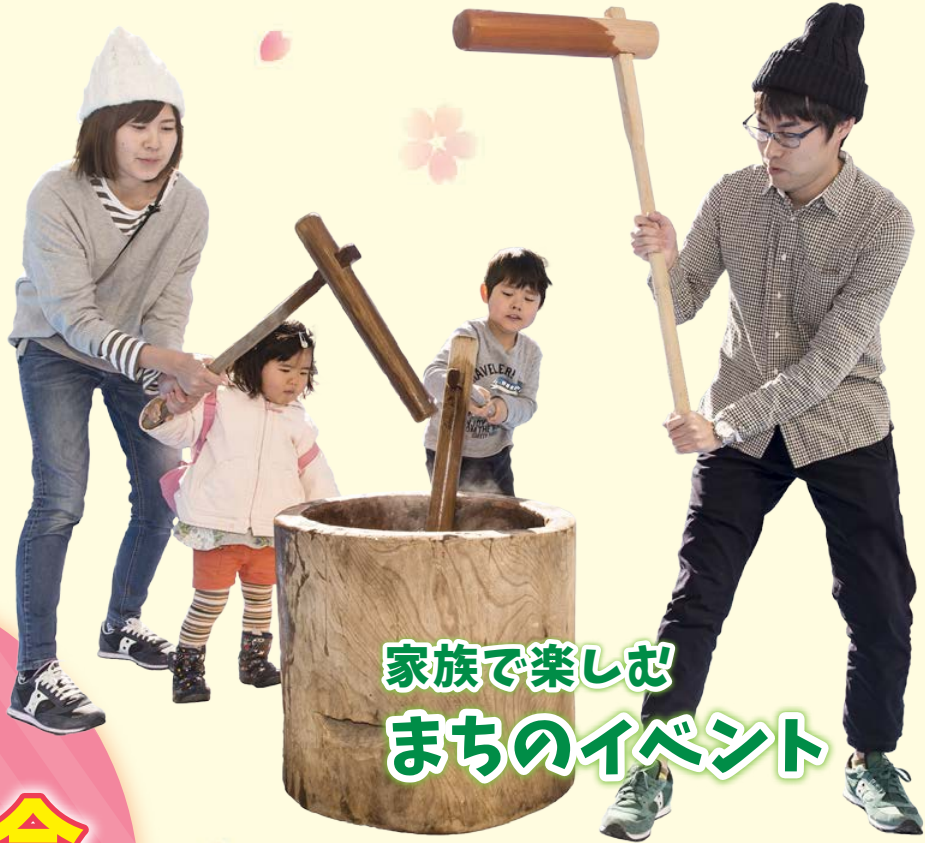
家族で楽しむ まちのイベント