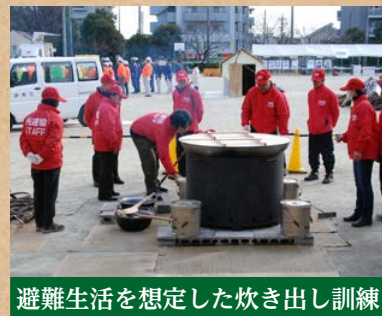
避難生活を想定した炊き出し訓練