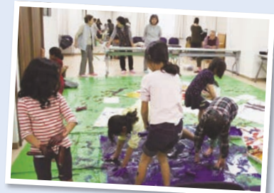
町会会館で親子向けにアート講座などの催しを開催 (平成29年度から はばたき部門)