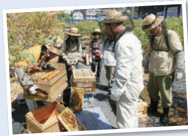
ミツバチの飼育によって特色のあるまちづくりを推進 (平成28年度から はばたき部門)

平成29年度に助成を受けたまちづくり団体が活動成果を報告します。▶日時:3月21日(祝)午後1時~5時▶場所:武蔵大学▶定員:100名(先着順)▶申込:当日会場へ