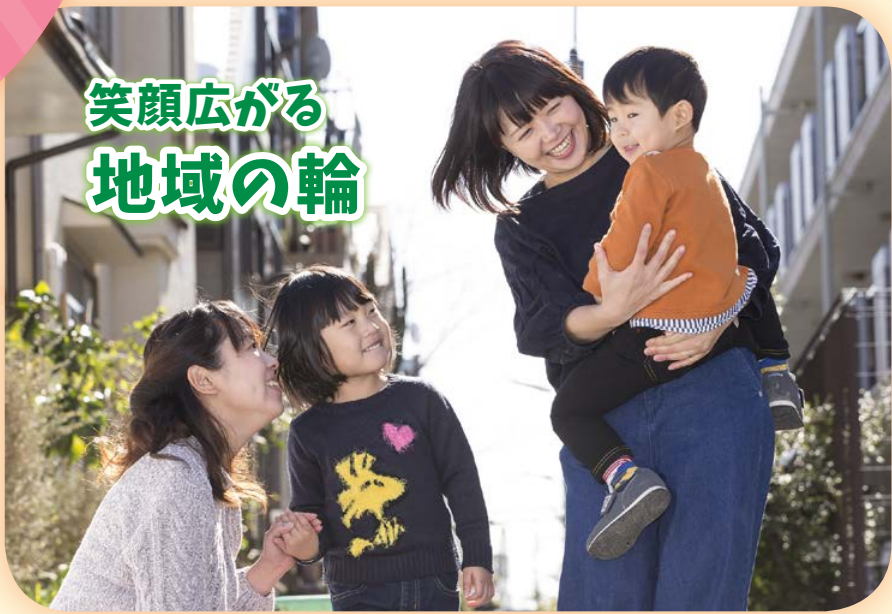
笑顔広がる 地域の輪