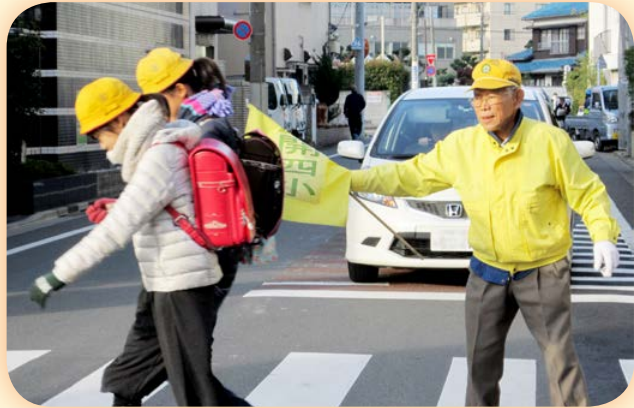
子どもを見守る 地域の目