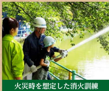
火災時を想定した消火訓練