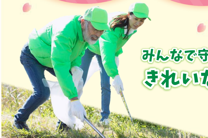
みんなで守る きれいなまち