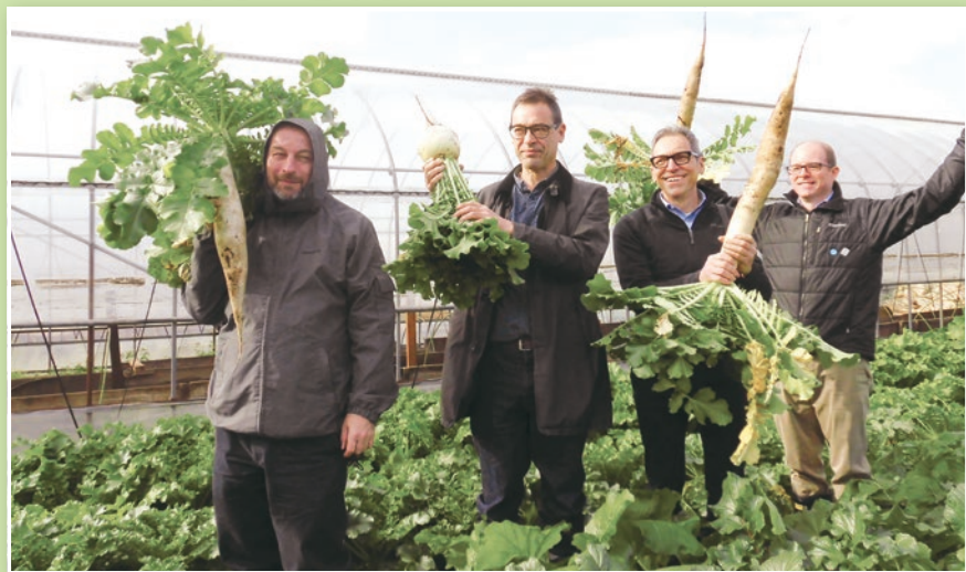
来年のサミットに向けて、区内の視察や区内農業者との意見交換を行いました。参加者は、都市の中にある農地やコインロッカー式の農産物直売所など、自国にない練馬の農の魅力を感じていました