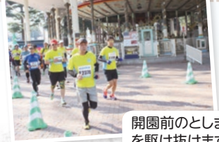
開園前のとしまえんを駆け抜けます