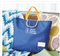
オリジナルエコバッグ