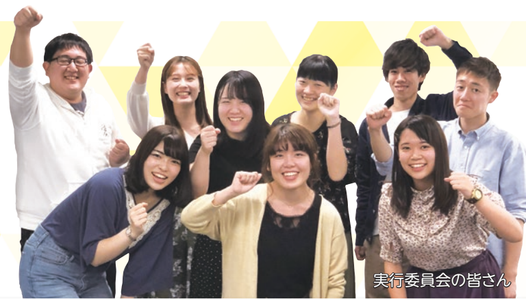
実行委員会の皆さん