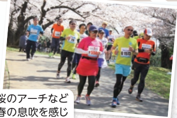
桜のアーチなど春の息吹を感じるコースです