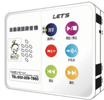
ハガキ大程度のコンパクトなサイズです

録音機を設置すると、電話の発信者にこれから会話を録音する旨の警告メッセージが流れます。これにより、振り込め詐欺の犯人は声が残ることを嫌がり、電話を切ることが期待できます。▶対象:区内在住の65歳以上の方のみの世帯 ※平成27・28年度に東京都から貸し出しを受けた方を除く。▶申込:危機管理課安全安心係(区役所本庁舎7階)や警察署(練馬・光が丘・石神井)にある申込書を、10月19日(必着)までに危機管理課安全安心係へ ※申込書は区ホームページにも掲載しています。 ※抽選結果は10月下旬にお知らせします。