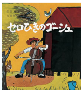
「セロひきのゴーシュ」文:宮沢賢治 昭和41年 福音館書店

▶申込:A往復ハガキまたは電子メールで①催し名②参加者全員(2名まで)の住所・氏名(ふりがな)・電話番号を、11月1日(必着)までに〒177-0045石神井台1-33-44 石神井公園ふるさと文化館分室 ✉event-bunshitsu@neribun.or.jp ※B/C事前の申し込みは不要です。