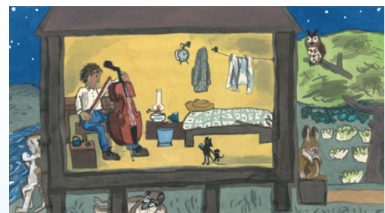
「野ねずみの病気を治すゴーシュ」セロひきのゴーシュより 昭和31年 ちひろ美術館蔵