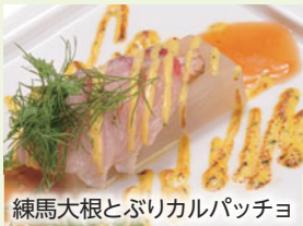
練馬大根とぶりカルパッチョ