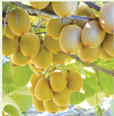
※写真はイメージです。メニューは変更になる場合があります。

ねりま観光ツアーは、新たな体験を通し、練馬の魅力と豊かな自然を再発見する催しです。▶日時・場所:①11月8日(休)②10日(土)午前10時都営大江戸線光が丘駅集合～おざわ農園～午後1時15分ホテルカデンツァ光が丘解散▶定員:各15名(抽選)▶参加費:2,500円 ※摘み取り代実費。▶申込:往復ハガキまたは電子メールで①催し名(①②の別も)②参加者全員の住所・氏名(ふりがな)・年齢・性別・電話番号を、10月19日(必着)までに〒176-0001練馬1-17-1 ねりま観光センター☎4586-1199 ✉kanko@nerima-idc.or.jp