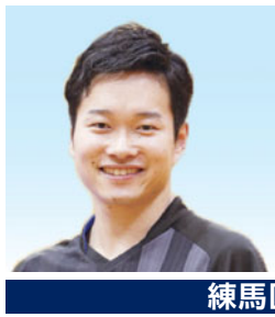
岩淵幸洋 リオデジャネイロ パラリンピック出場の 卓球選手