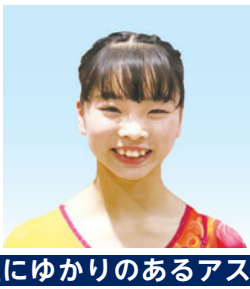
大口真奈 東京2020 オリンピックを目指す 体操選手