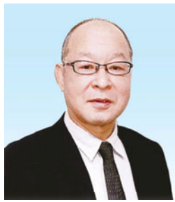
野瀬清喜 ロサンゼルス オリンピック 柔道銅メダリスト