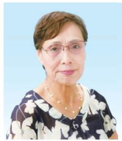
千葉勝美 東京1964オリンピック バレーボール 金メダリスト

東京2020オリンピック・パラリンピック競技大会に向けて、オリンピック・パラリンピアンによる講演や、オリンピック・パラリンピック出場をテーマにお話を伺います。