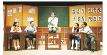
夜明けの落語(舞台写真)