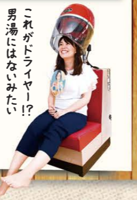
これがドライヤー!? 男湯にはないみたい