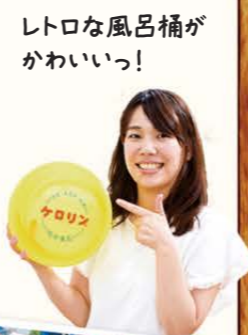
レトロな風呂桶がかわいい!!

お湯があふれるほどの広い湯船で心も体もリラックス。たくさん汗をかくので、水分補給もお忘れなく!