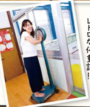
大きな針が動くレトロな体重計!!