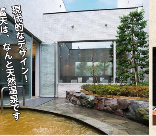
現代的なデザイン! 露天は、なんと天然温泉です