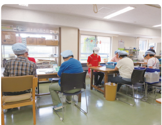
日常生活の場や働く機会などを提供します(写真は白百合福祉作業所)