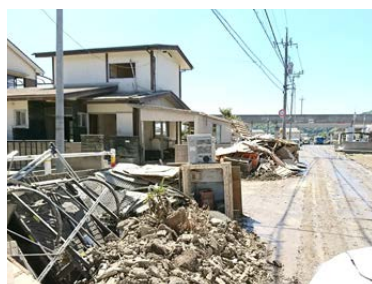
岡山県倉敷市真備町の被害の様子