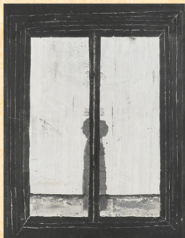
《扉》昭和43年 墨・紙 筑波大学・石井コレクション