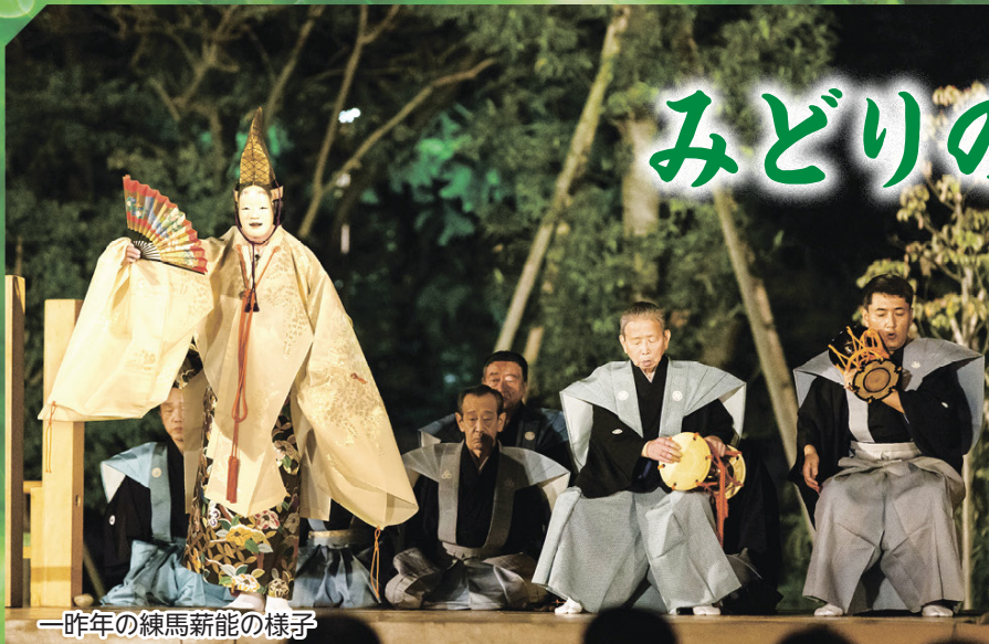
一昨年の練馬薪能の様子