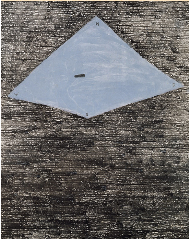
《からす西へ行く》昭和43年 モノタイプ・紙 練馬区立美術館蔵