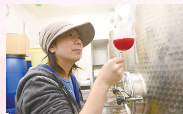
地元産の野菜やワインを身近に感じってもらうために、地域の方を積極的に巻き込む越後屋さん

白石 私たち生産者側から見ても、身近なところに消費者がいるということはとても幸せなことです。体験農園や食育など、私たちの生活や教育にも関わることができて、やりがいを感じながら農業を営んでいます。