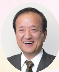
練馬区長 前川 耀男

練馬区の更なる発展に向けて、区民の皆さまとともに、 全力を挙げて取り組んでまいります。