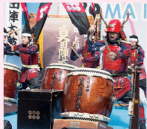
信州上田真田陣太鼓保存会