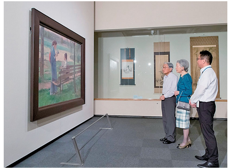
「池畔納涼」(明治31年) ご鑑賞の様子