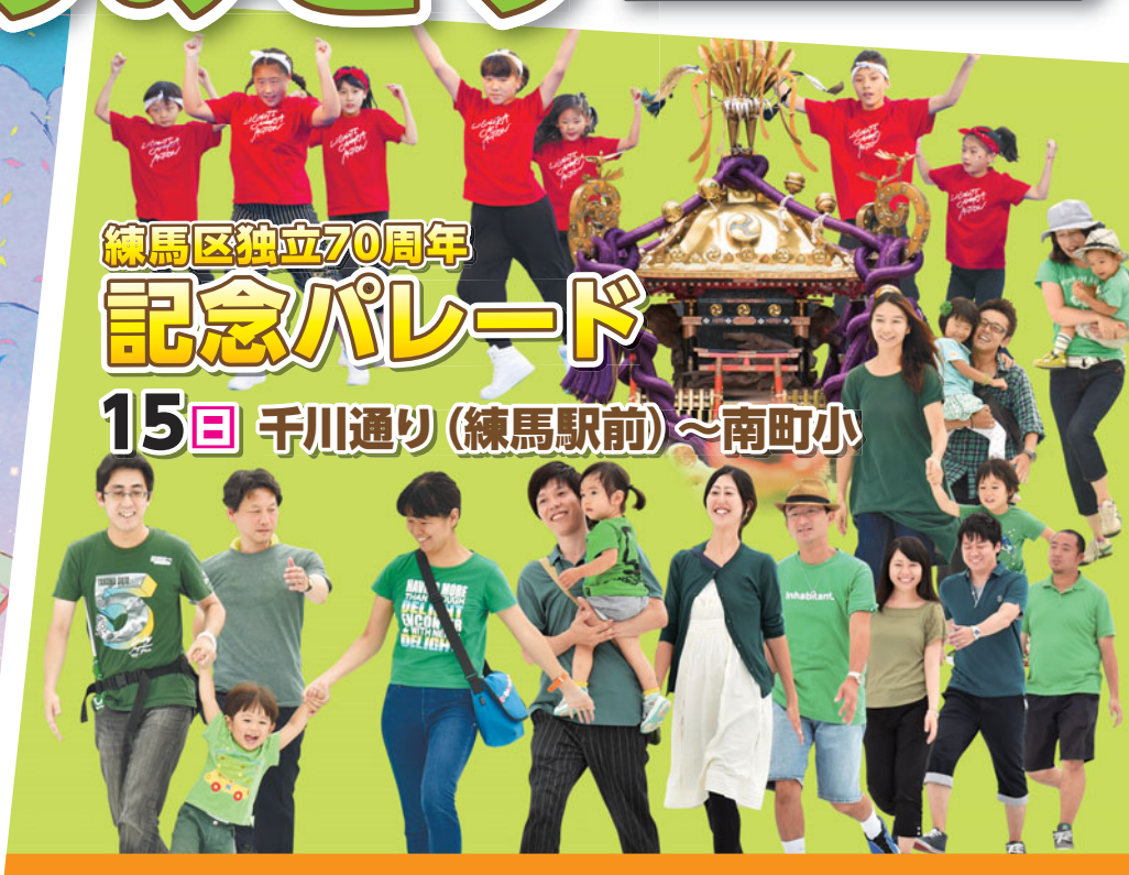
練馬区独立70周年 記念パレード 15日 千川通り(練馬駅前)～南町小