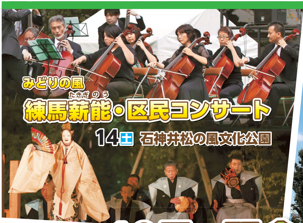
みどりの風 たきぎのう 練馬新能・区民コンサート 14日 石神井松の風文化公園