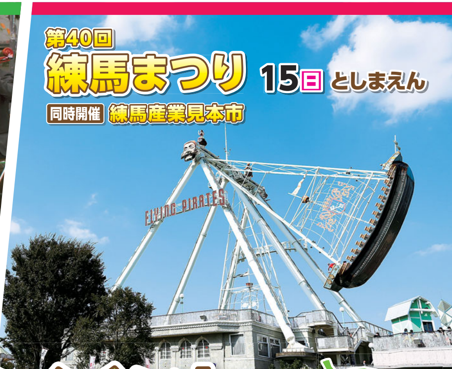
第40回 練馬まつり 15日 としまえん 同時開催 練馬産業見本市