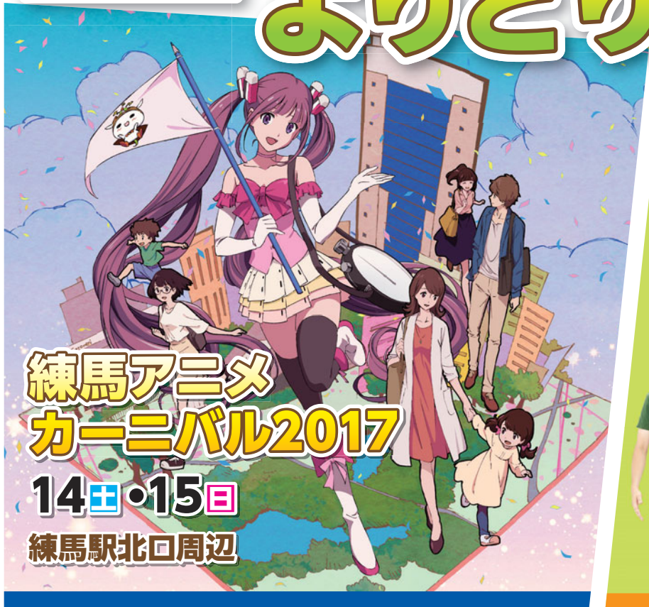
練馬アニメ カーニバル2017 14日・15日 練馬駅北口周辺