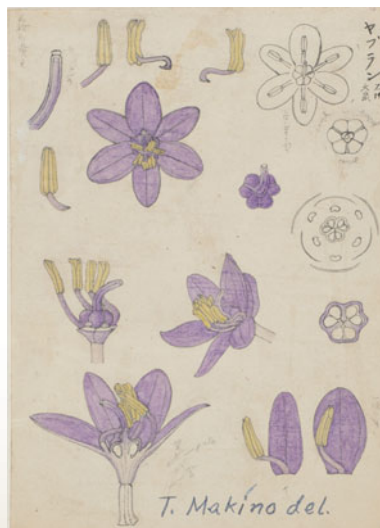
ヤブラン 牧野富太郎 ケント紙 墨 彩色 昭和18年 高知県立牧野植物園蔵

植物の成長段階ごとに丹念にスケッチした観察図や、印刷屋泣かせと言われるほど細かく指示の入った校正図を通じて、牧野富太郎による植物図の作成過程の裏側に迫ります。 ※高知県立牧野植物園共催。