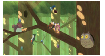
前回の受賞作品「うたうせみ」

ジャパンアニメーション発祥の地、練馬でアニメコンペティション(アニメ作品を募集し、優秀作品を決めるもの)を開催します。お子さんから大人まで、皆さまの応募をお待ちしています。審査を行い、受賞者には賞金または賞品を差し上げます。申し込み方法など詳しくは、練馬アニメーションサイト( http://animation-nerima.jp/event/compe/ )をご覧ください。