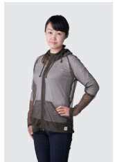
軽くて涼しいメッシュパーカー