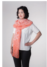
さらっとふんわりしたエレガントストール

「繊維」に「虫よけ加工」した新しい虫よけのカチ。無色無臭で、繰り返し洗濯しても高い効果が長く持続。