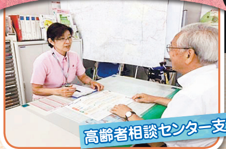
高齢者相談センター支所