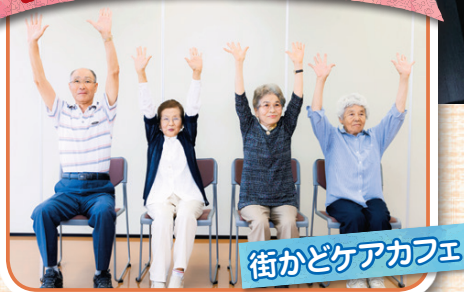
街かどケアカフェ