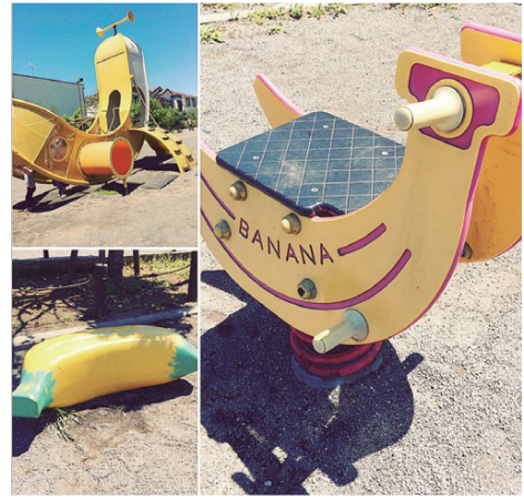
田柄5-3-6で撮影。4月23日投稿。

今日は天気が良かったので子どもを連れて「ばなな公園」に行ってきました(^^)。ここは名前の通り設置してある遊具がバナナをモチーフにして作られているという風変わった公園で、バナナ好きな子どもたちは喜びごと間違いなし!