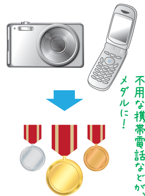
不用な携帯電話などが、メダルに!