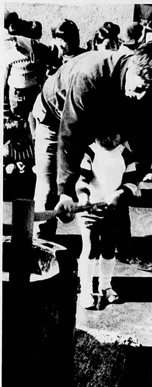
もちつき大会(厚生文化会館にて)