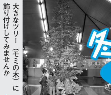
大きなツリー(モミの木に飾り付けしてみませんか)