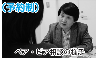
ペア・ピア相談の様子

障害児(者)を育てた実体験を持つペア・ピア相談員が障害児(者)を持つ親のさまざまな悩みの相談に応じます。