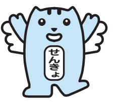
明るい選挙のイメージキャラクター「選挙のめいすいくん」

行います。東京都選出は候補者名を、比例代表選出は候補者名または政党名を記入してください。