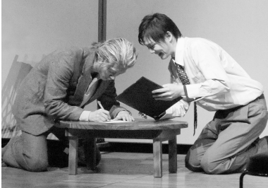
一人暮らし高齢者宅を舞台にした演劇を通じて、成年後見制度について紹介します

権利擁護センターほっとサポートねりまでは、成年後見制度(※)をより多くの方に知っていただくため、演劇の公演と個別相談会を行います。ぜひおいでください。 ※成年後見制度：認知症や知的・精神障害などによって物事を判断する能力が十分でない方のために、本人の権利を守る成年後見人などを選ぶことで、本人を法的に支援する制度。