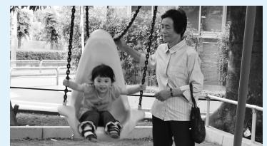
豊玉公園の遊具(背もたれのついたブランコなど)は、使う人の視点で整備しました

モニターとして登録した、障害のある方や高齢者、子育て中の方、福祉のまちづくりに関心のある方からの情報提供や多様な意見を基に、交差点の整備や区立施設の改修を行っています。また、豊玉公園(豊玉北6-8-3)の改修工事の際に参考とするため、モニターの方から意見をいただきました。