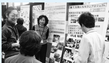
助成を受けた区民グループは、写真や制作物などを使い、1年間の活動成果報告を行います

区民グループによる企画・提案を募集し、その事業の費用を一部助成しています。助成を受けた区民グループは、福祉のまちづくりの課題の解決や普及啓発活動などを行っています。また、この支援事業を活用して、区民グループがバリアフリーマップなどを作成しました。