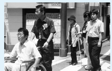
実際にまちを歩きながら、暮らしやすいまちについて検証を行います

協議会は、区民、事業者、有識者で構成され、ユニバーサルデザイン(※)モデル地域などの現地調査などを行い、「練馬区福祉のまちづくり総合計画(18~22年度)」の検証を行っています。 ※ユニバーサルデザイン…年齢や障害の有無などに関わらず、多くの人が利用しやすいように配慮されたデザイン。