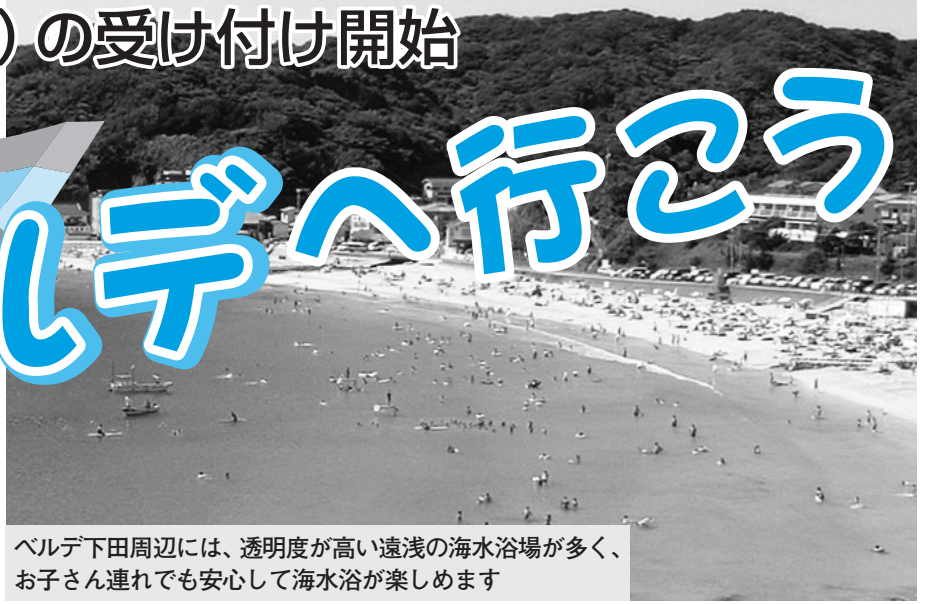
ベルデ下田周辺には、透明度が高い遠浅の海水浴場が多く、お子さん連れでも安心して海水浴が楽しめます