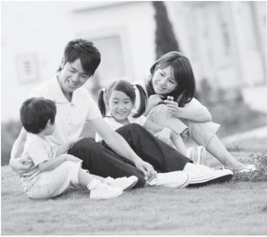
地域防災計画の見直しや節電対策、放射線などの測定など、区民の皆さまが安心して生活できるように、取り組みを進めます

節電実施計画に基づき、区立施設では、室温の28度設定や照明の削減などの節電対策に取り組んでいます。7～8月は、区立施設全体で電力使用量15%削減の目標を上回る約20%の削減を達成しました。