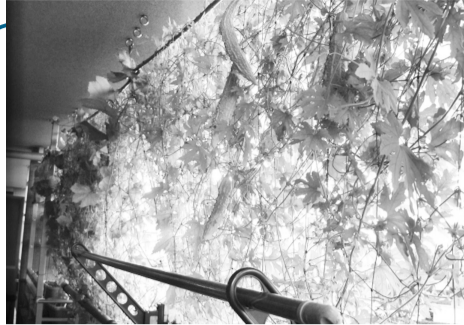
ゴーヤで窓の外を覆い、日差しを和らげるみどりのカーテンで、室温の上昇を防ぎましょう