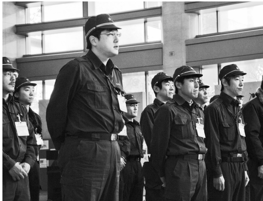
4月12日の出発式で区長から激励を受けた第1次派遣職員18名が、亘理町に向かいました。当初1か月間で延べ578名の職員が被災者の支援にあたります

発行/練馬区 編集/広聴広報課広報係 〒176-8501豊玉北6-12-1 ☎3993-1111(代表) Fax3993-1194 http://www.city.nerima.tokyo.jp/