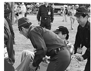
昨年9月に行われた震災総合訓練での要援護者の避難訓練

障害や高齢などのため、自力で避難することが難しく、支援を必要とする方に、災害時要援護者名簿への登録を進めています。名簿を、警察・消防署、区民防災組織などに提供することで、災害時に迅速な支援が得られるよう体制を整備しています。