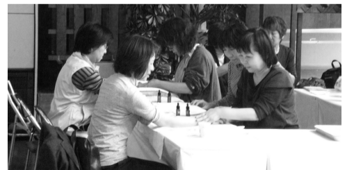
ハーブの香りでリラックス

①観葉植物でこけ玉を作ろう...: 4月29日(祝)午前11時~午後3時▽参加費 300円(材料費)▽申込 当日会場受け付け ハーブの香りのハンドトリートメント ハーブティーを飲みながら、花の精油で手のトリートメントをします。 一輪アサガオの花を咲かせよう アンケートに答えた先