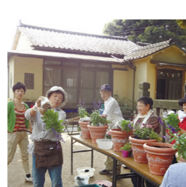
専門家派遣の様子

⑤まちづくりに関する調査・研究 まちづくりに関する課題解決や、区の特徴を生かしたまちづくりに関する調査・研究などを行っています。 ⑥区が行うまちづくり事業に対する支援や協働 区が行う住民参加型事業などの企画・運営を支援しています。 ⑦みどりに関する取り組み みどりを保全し、新たに創出するための制度活用や研究を行っています。