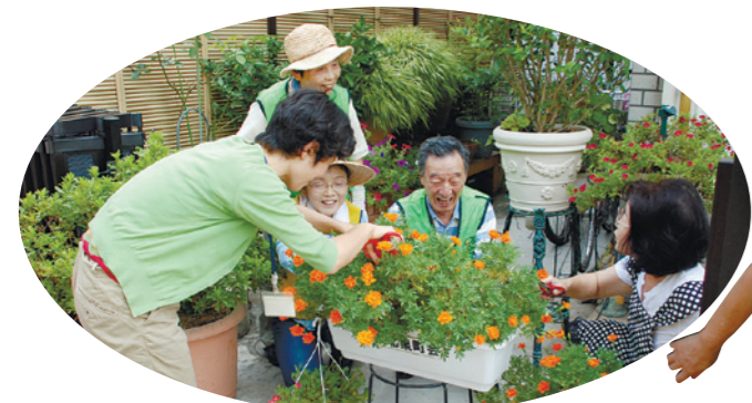
練馬まちづくりセンターから派遣された専門家のアドバイスを受けながら、楽しくきれいな花を育てています

なみがきれいになることはもちろんですが、花をきっかけに近所の方と「お宅の花は元気ね。どうやって育てるの?」という会話が生まれ、住民の気持ちも明るくなります。ぜひ、他の地域の方も、近所の仲間と始めてみてもらいたいですね。