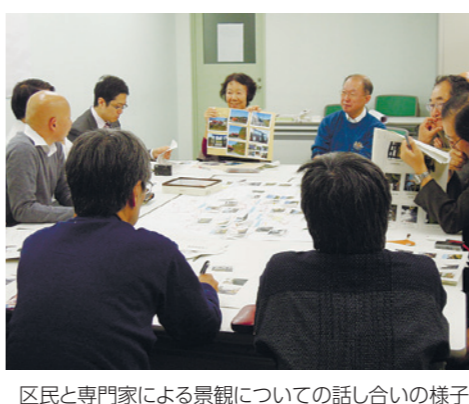
区民と専門家による景観についての話し合いの様子

①まちづくりに関する相談 まちづくりやみどりの専門家がお待ちしています。 ②まちづくりに関する情報提供 まちづくりや都市計画に関する図書の閲覧・貸し出しや、地域の情報、まちづくりに関する知識を発信しています。 ③まちと人とのつながりづくり 講座やまち歩きイベント左の記事参照を開催し、地域の魅力を伝えます。 ④まちづくり活動を支援 区民主体のまちづくり活動に対する助成や、話し合いの場への専門家派遣などを行っています。