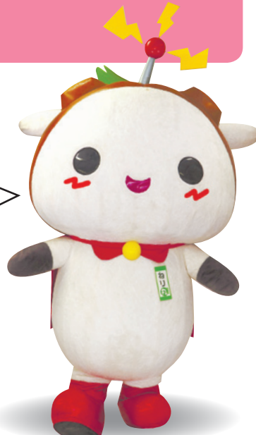
練馬区公式アニメキャラクター「ねり丸」©練馬区