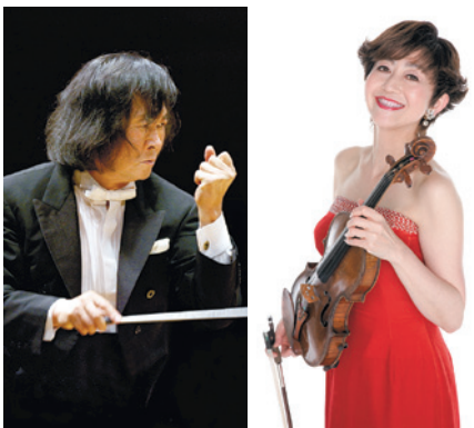
小林研一郎 大谷康子

入場料 S席3,500円、A席3,000円、B席2,500円(全席指定) ※車いす席は、本人・付添者とも1,750円。