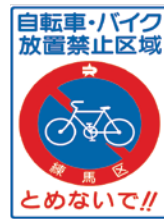
自転車・バイク放置禁止区域の路面ステッカー

区は、駅周辺を中心に放置禁止区域を指定しています。区域内に放置された自転車・50CC以下の原動機付自転車は、警告放送を流し、警告後も移動がない場合、置いていた時間・理由にかかわらず撤去をしています。ガードレールなどに固定している自転車などは、チェーン錠などを切断し、撤去します。