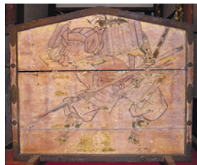
「牛若丸・弁慶図絵馬」 両絵馬とも縦126cm×横148cm。江戸時代の作と推定される二面一対の大型の絵馬で、牛若丸・弁慶が五条橋で出会う場面を描いています

「東京文化財ウィーク2013」は、都内全域で国や東京都指定の文化財を一斉に公開したり、文化財に関連した事業を行ったりするイベントです。区内でも長命寺の所有する「板絵着色役者絵」を特別に公開するなど、さまざまな催しを開催します。▶問合せ: ①②伝統文化係 ☎5984-2442 ③～⑤石神井公園ふるさと文化館 ☎3996-4060 ※都内で開催するイベントを紹介したガイド冊子「東京文化財ウィーク」を図書館、文化・生涯学習課(区役所本庁舎11階)、石神井公園ふるさと文化館などで配布します。