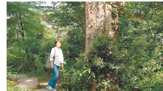
石庭の森緑地で幹回り3mを超える大ケヤキと

ポイント 2 知ればもっと好きになる 石庭の森緑地(東大泉7-50)は、平成17年に、マンションになる予定だった屋敷林を守るために区が買い取り、地域の方と協力して整備したものです。こうした地域との関わりを調べて知ると、美しい緑地にもっと愛着が湧いてきます。