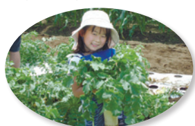
爽やかな秋に楽しみながら 野菜について学べます

JA東京あおばの協力により、石神井地区の2つの畑を回り、生産者との交流や季節の野菜の観察・収穫を行います。収穫した野菜は持ち帰れます。▶対象:区内在住の5歳以上の方で、大人を含む2~4名のグループ▶日時:11月10日(日)午前10時~正午▶場所:石神井台・関町北周辺▶定員:50組(抽選)▶費用:1組500円 ※他に保険料1人30円。▶申込:ハガキまたはファクスで①催し名②参加者全員の住所・氏名・年齢③代表者の氏名・電話番号を、10月11日(必着)までに〒176-8501区役所内農業振興係☎5984-1403 FAX3993-1451 ※申し込みは1グループにつき1通までです。