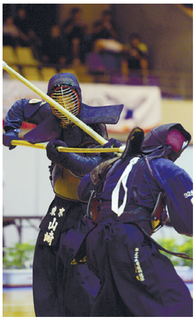
区内では、9月29日(日)～10月1日(火)に国民体育大会の銃剣道競技会、10月12日(土)～14日(祝)に全国障害者スポーツ大会のソフトボール、フットベースボール競技会が開催されます