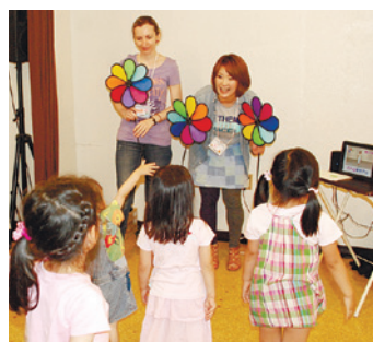
子どもは楽しく英会話などを学び、ママは自分の時間を楽しまます

向けの英会話とダンス教室です。家事や育児の負担が少なそうな時間帯を選び、費用は抑えめにして、ママがおしゃべりしたり、おやつを食べたりしている隣で、子どもたちは英会話やダンスを学べる教室です。 将来的には、その時間を利用してママたちが資格取得のための勉強をしたり、趣味の教室を自ら開催した