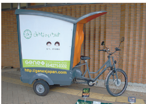
カーゴサイクルで野菜と笑顔をお届けします

行うサービスを始めました。地域のお客様と顔を合わせながら、常連さんの表情がいつもと違うのに気が付いて声をかけたり、逆に私がアドバイスをいただいたり、人や地域とのつながりの大切さを実感します。また、区内の農家の方やJA東京あおばなどの仕入れ先の方、北町の商店街の皆さんの協力には感謝の毎日です。「みんながあつまるといちは」を目指