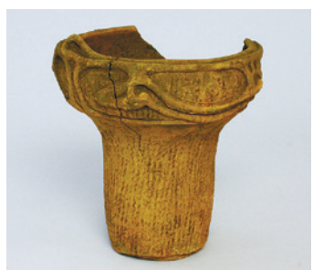
縄文土器 (石神井公園ふるさと文化館で展示)

昭和47〜48年に、石神井城跡の東に位置する池淵遺跡で発掘調査が行われました。園内では旧石器時代に料理を行った跡である礫群(れきぐん)や、縄文時代中期の住居跡、中世の溝状遺構などを埋戻して保存しています。