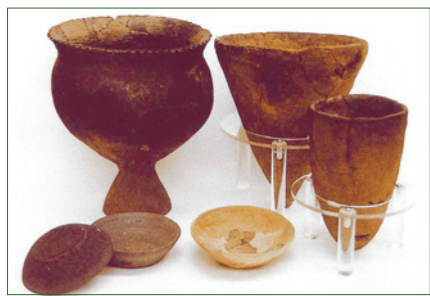
縄文土器・弥生土器・土師器 (はじき)・須恵器 (春日小・石神井公園ふるさと文化館で展示)

旧石器時代〜古墳時代、平安時代の集落遺跡です。園内では弥生時代の住居跡や、発掘調査に参加した小