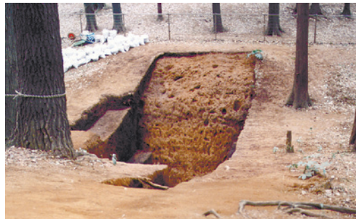
平成10年の調査時の空堀 (現在は埋戻されています)