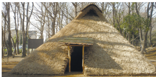
復元住居 (城北中央公園内)

中学生が描いた縄文人の絵のタイトルや銅鐸(どうたく)のモニメントなどが見られます。