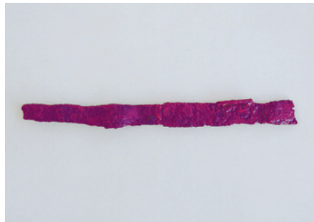
小刀 (石神井公園ふるさと文化館で展示)