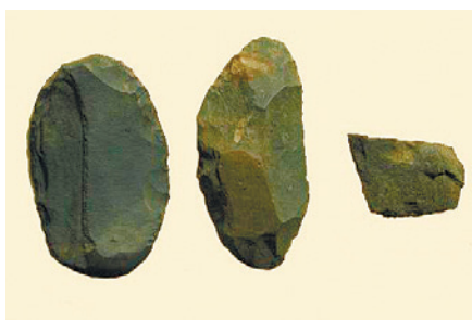
旧石器時代の局部磨製石斧(せきふ) (石神井公園ふるさと文化館で展示)

中学生が描いた縄文人の絵のタイトルや銅鐸(どうたく)のモニメントなどが見られます。