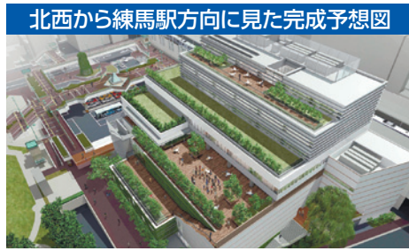
北西から練馬駅方向に見た完成予想図 施設は、周辺地域と調和する階段状の建物とし、 壁面・屋上緑化により、隣接する平成つつじ公園と 連続したみどりの空間を創り出します

設のうち、練馬産業振興セン ター・区民交流ホール・区民 協働交流センターを「区民・ 産業プラザ」として1つの施 設に位置付けます。26年3 月の完成を目指すとともに、 円滑な管理・運営の準備を 進めます。