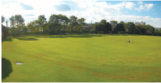
「石神井松の風文化公園」という名称案は、区民の皆さまから寄せられた案を基に、名称候補選定委員会の審議を踏まえ決定しました

松の風文化公園」と定めまし た。この名称には、公園のテ マである自然・スポーツ・文 化が調和したものとなるよ うにとの願いが込められてい ます。26年春の開園を目指 し、整備を進めています。