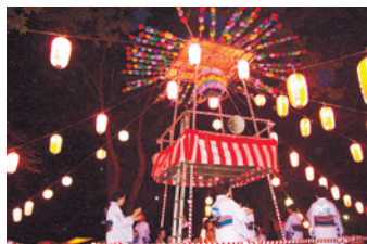
夏祭りなどで地域の交流を図っています