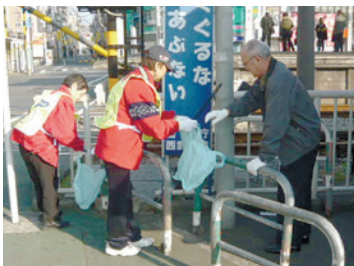
区内一斉清掃の様子

きれいなまちは、犯罪の抑止効果があります。区は、ポイ捨て防止キャンペーンや、駅や駅周辺の道路などにフラワーポットを設置する「駅からはじまる花いっぱい運動」、放置自転車対策などにより、駅前のクリーンアップに努めています。