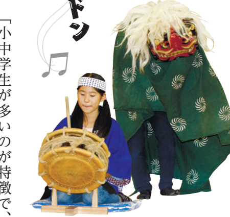
問合せ: 広報係 ☎5984-2690

「小中学生が多いのが特徴で、練習はいつも和気あいあいとしており、活気にあふれていますよ」