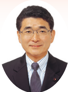
練馬区議会議長 藤井たかし