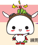
練馬区公式アニメキャラクター「ねり丸」©練馬区

成人の日のつどいは、公募で選ばれた新成人による実行委員が式典のアトラクションの企画・運営を行います。新成人の皆さまの心に残る式典となるよう、学校や仕事の合間に準備をしてきました。