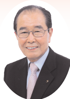
練馬区長 志村豊志郎