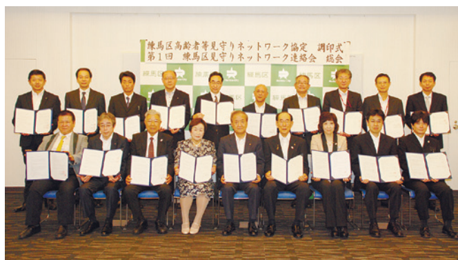
前川区長と協定締結団体の皆さま

協定締結団体は、新聞や郵便物がたまっている、洗濯物が干されたままになっているなどの異変を発見した際、速やかに高齢者相談センターや警察などに連絡を行います。連絡を受けた区は、安全確認など必要な対応を行います。また、定期的に区と協定締結団体で会合を開き、情報交換を行います。