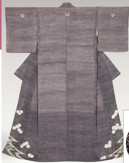
山道に小花小紋地 裾菊に流水文着物 幕末～明治初期 今昔西村蔵