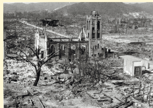
広島流川教会(昭和20年9月頃撮影)

▶日時: 8月2日(土)~15日(金) 午前8時30分~午後8時(土・日曜は午前8時45分から。最終日は午後4時まで) ▶場所: 区役所アトリウム、石神井庁舎5階