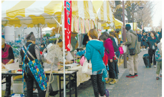
フェスティバルでは、さまざまな模擬店が出店します

〒176-1779 地域の方 …練馬清掃事務所 ☎3992・7141 〒177-1778 地域の方 …石神井清掃事務所 ☎3928・1353