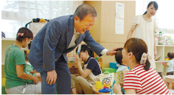
大泉子ども家庭支援センターでは、保護者の方から子育てのさまざまなニーズを聴きました