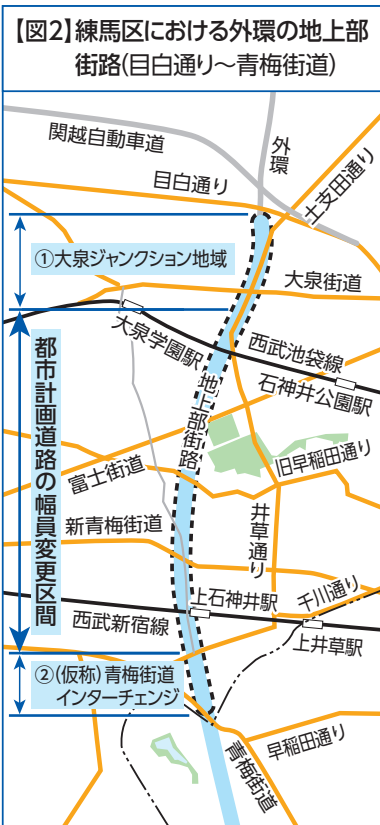
【図2】練馬区における外環の地上部街路(目白通り~青梅街道)