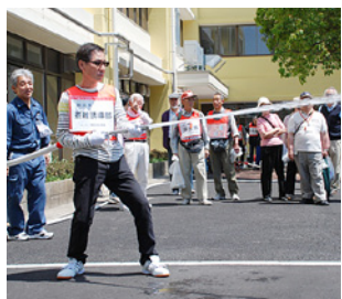
防災学習センターでは、消火器訓練など実践的な訓練が体験できます