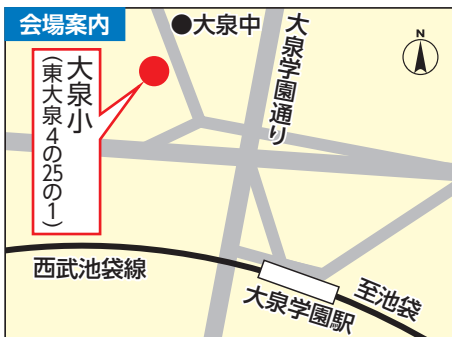
▶交通: 西武池袋線大泉学園駅下車北口徒歩3分