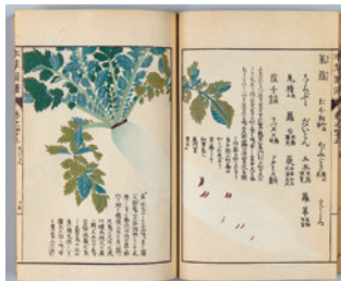
本草図譜(練馬区蔵) 植物図に解説を付した本草書。大根の解説の中で「練馬・徳丸(板橋区)の産で「塩蔵に良し」と記されている