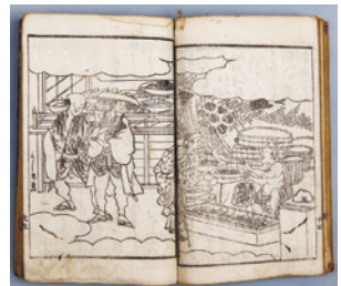
旧観帖(明治大学図書館蔵) 江戸時代の滑稽本。蒲焼は買わず隣の屋台で焼き魚を買ひ、蒲焼の匂いを嗅ぎながら食べている場面