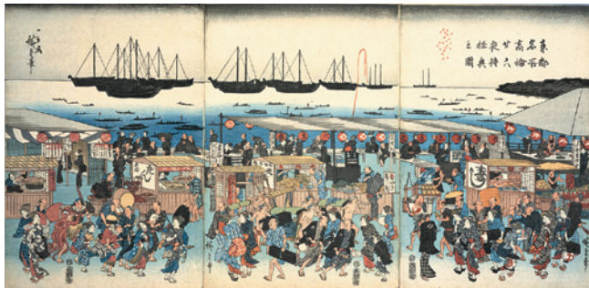
東都名所高輪廿六夜待遊興之図(神奈川県立歴史博物館蔵) 廿(二十)六夜待は旧暦7月26日の夜に日の出を待って拝む行事。すし屋・てんぷら屋・だんご屋などの屋台が出て、人々でにぎわっている様子が描かれている

▶日時:2月1日(日)午後0時30分～3時 ▶場所:アオバジャパンインターナショナルスクール(光が丘7-5-1) ▶内容:起震車・はしご車の体験訓練、初期消火訓練など ▶申込:当日会場受け付け ▶問合せ:区民防災第一係 ☎5984-2601 ※知り合いの外国人に紹介してください。