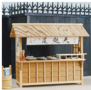
江戸時代のてんぷら屋の屋台(模型。三浦宏制作・所蔵)

江戸時代後期、江戸のまちは特色ある食文化が発展しました。江戸の食を支えた食材のうち、野菜類に関しては江戸近郊の村々から供給され、練馬大根もそうした野菜のひとつでした。本展では、和本や浮世絵などを通じて、にぎりずし・そば・てんぷらなどの江戸の特色ある食文化と、江戸の食を支えた練馬大根について紹介します。※会期中、一部資料の展示替えがあります。