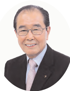
練馬区長 志村豊志郎

区民の皆さまにおかれましては、すがすがしい新春をお迎えのことと、お慶び申し上げます。本年4月、練馬駅北口に保育所や区民・産業プラザなどの区立施設と商業施設やリハビリ病院などの民間施設からなる「Coconeri(ココネリ)」が