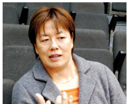
【プロフィール】 1988年ソウルオリンピック銅メダル、1992年バルセロナ・1996年アトランタオリンピックでは銀メダルを獲得。女性初の全日本柔道連盟理事。

9歳の時に親と一緒にやったことがきっかけです。テニスを通じて礼儀やマナーが身に付き、諦めない心が芽生えました。