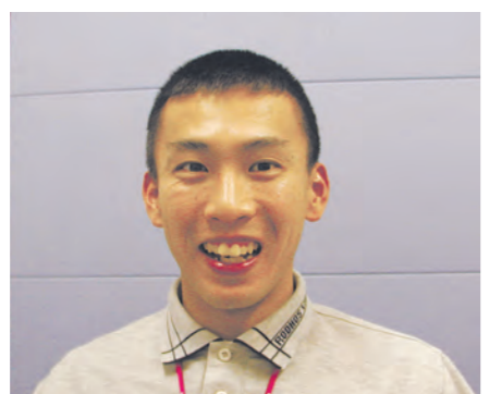
【プロフィール】 2006年にサクスステップ(株)に入社。2011年に1500mで日本新記録を樹立。2012年ロンドンパラリンピック陸上1500m(知的障害)に出場し9位。

中学1年の時、担任の先生に勧められて陸上を始め、初出場した大会の1500mで優勝したことをきっかけに走ることが大好きになりました。社会人になってからは、仕事と両立しながら、得意とされている長距離ではなく、海外の大会で主流の1500mに一生懸命打ち込みました。パラリンピックを意識し始めてからは、より一層練習に力が入るようになり、記録も順調に伸びていきました。ロンドンパラリンピックへの出場が決まった時は本当にうれしかったです。