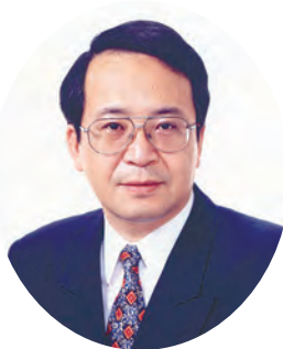
練馬区議会議長 小泉純二

区議会を代表して、謹んで新年のご挨拶を申し上げます。本年が区民の皆さまにとって、幸多い輝かしい年となりますよう、心からお祈り申し上げます。 区議会は代表して、謹んで新年のご挨拶を申し上げます。本年が区民の皆さまにとって、幸多い輝かしい年となりますよう、心からお祈り申し上げます。