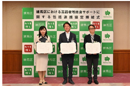
▲練馬区・練馬区社会福祉協議会・ 全国高齢者等終身サポート事業者協会