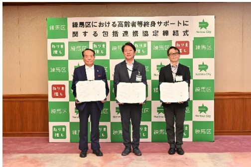
▲練馬区・練馬区社会福祉協議会・ 全国高齢者支援団体連合会