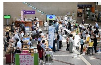
▲前回開催のようす