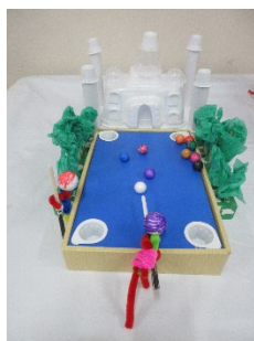
▲「大きくなったら…？小さくなったら…？」の展示