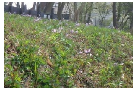
▲カタクリが群生して咲く様子（昨年の様子）

カタクリは、種子から花が咲くまでに7年以上かかると言われている。草丈は15cmほど。2枚葉を出し、2枚の葉から出る茎の先に花をつける。花は通常紅紫色で下を向き、6枚の花びらを外に反り返らせて咲くのが特徴。一株の開花期間は一週間程度で、例年3月下旬から4月上旬にかけて次々に咲き始める。