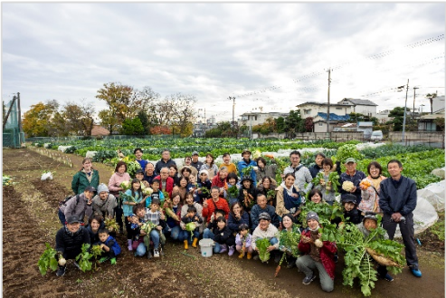
▲農業体験農園の利用者の皆さん